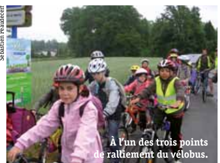
À l'un des trois points de ralliement du vélobus.