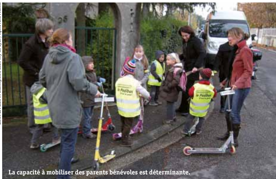
La capacité à mobiliser des parents bénévoles est déterminante.

Comment dès lors pérenniser un système qui repose sur la bonne volonté des parents ?