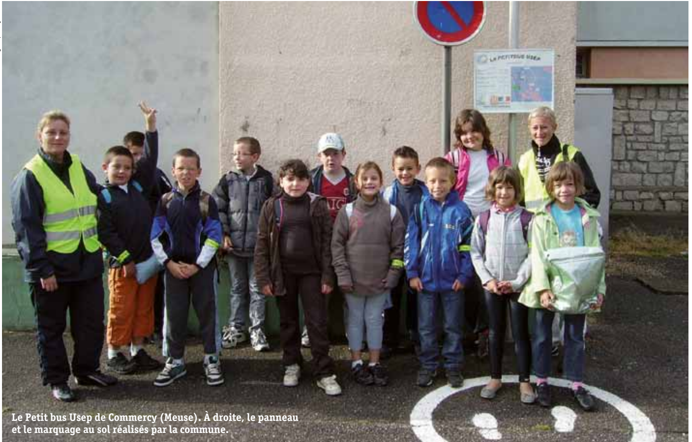
Le Petit bus Usep de Commercy (Meuse). À droite, le panneau et le marquage au sol réalisés par la commune.

agglomérations qui ont ouvert la voie. Le Grand Lyon, par exemple, a mis en place sa première ligne en 2002 et développé une politique volontariste sous le slogan « Marchons ensemble vers l'école » (1). Aujourd'hui, l'agglomération peut s'enorgueillir de compter 142 lignes quotidiennes, touchant plus de 2000 enfants. Dans la foulée, des ramassages scolaires pédestres ont peu à peu fait leur apparition dans d'autres grandes agglomérations, comme Rennes, dans les villes moyennes, les zones périurbaines et les zones rurales, ainsi qu'en outremer (2).